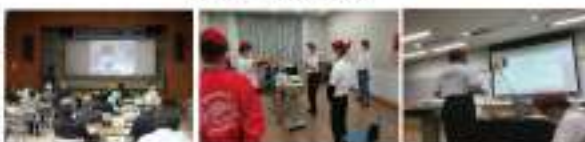
ウィズ・コロナのパトロール方法