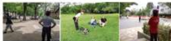
公園の見守り活動