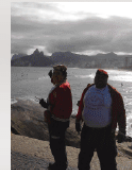
イタリア (カリアリ支部)