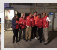
スイス (ジュネーブ支部)