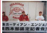
本ガーディアン・エンジェル 関西本部認定記者会

平成 8 年 3 月、設立されて間もない東京支部の門を叩き、活動に参加するようになった。阪神淡路大震災後のボランティアアブーム・少年犯罪の増加が取り沙汰される中でのスタートだった。それから 20 年、刑法犯認知件数は平成 14 年の 285 万件をピークに減り続け、昨年は 110 万件にまでになった。社会全体を取り巻く環境も大きく変わり、防犯パトロールは表舞台からは消え、「こども食堂」のような、より地域に根ざす活動が期待されるようになってきた。犯罪にまつわる状況も、街頭犯罪から、貧困・家族間・高齢者をキーワードとするものに移行しているように見受けられる。我々 GA に求められる姿も、街頭パトロールによる外的サービスに留まらず、メンバーのスキルを高める内的サービスがより求められる状況にあると思う。